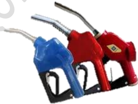
All Auto & Manuel Nozzle