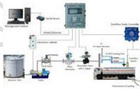
Management system for oil station