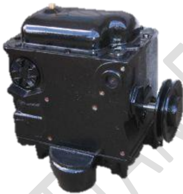
Tokheim Type gear pumps