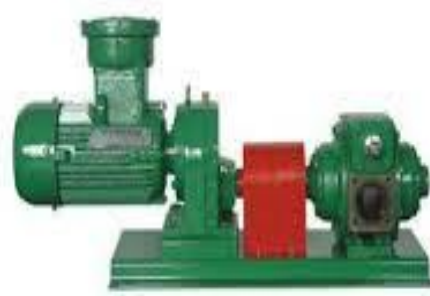
Yb pumps with coupling drive