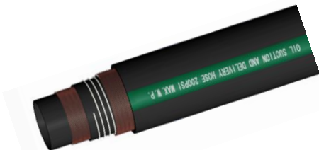
Fuel oil discharge hose