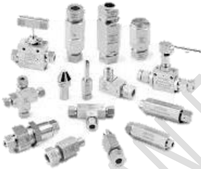
Swivel & Valve