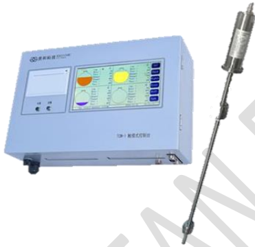
TANK GAUGE SYSTEM